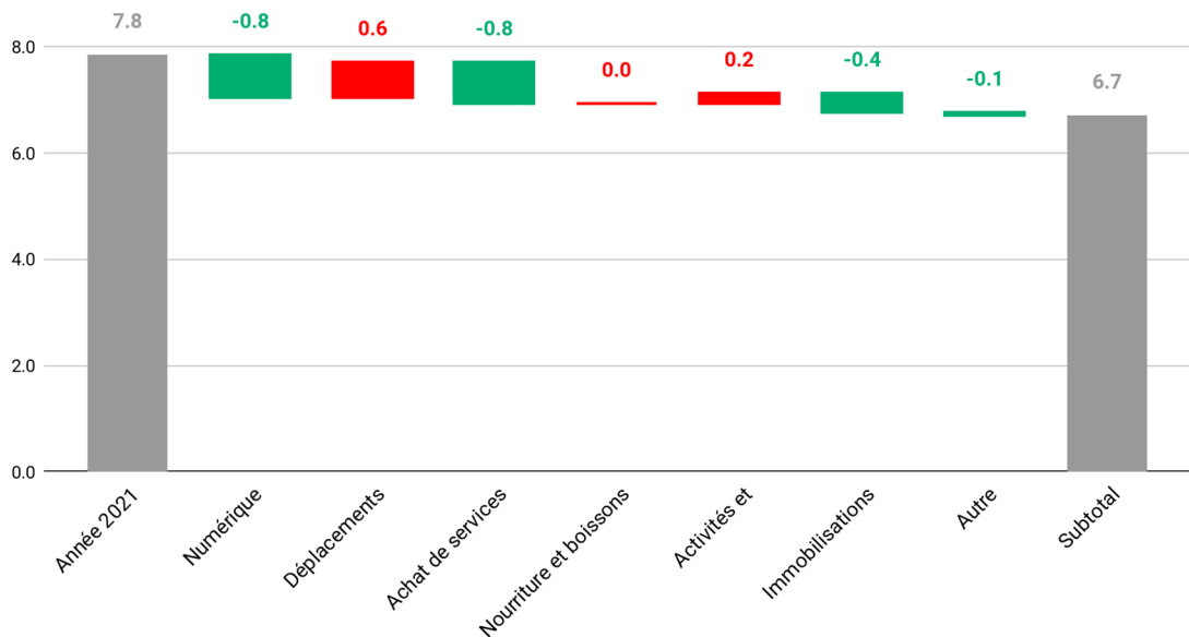
Évolution des émissions totales de METSYS, par activité (tCO2e/collaborateur)

Dans les postes principaux de METSYS, 3 ont vu une augmentation de leurs émissions, et 4 une diminution.